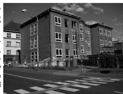
Halasova se už na svět dívá vyměněnými okny.